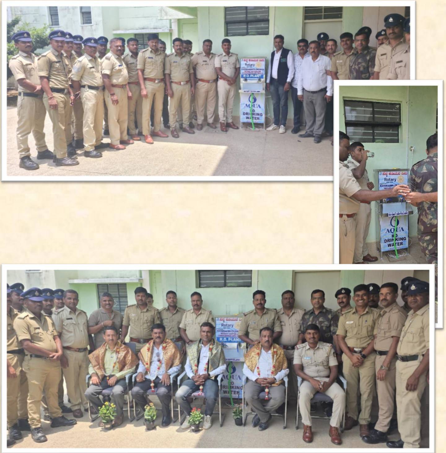
The ceremony of handing over the RO unit to the training centre was well covered in the newspapers.